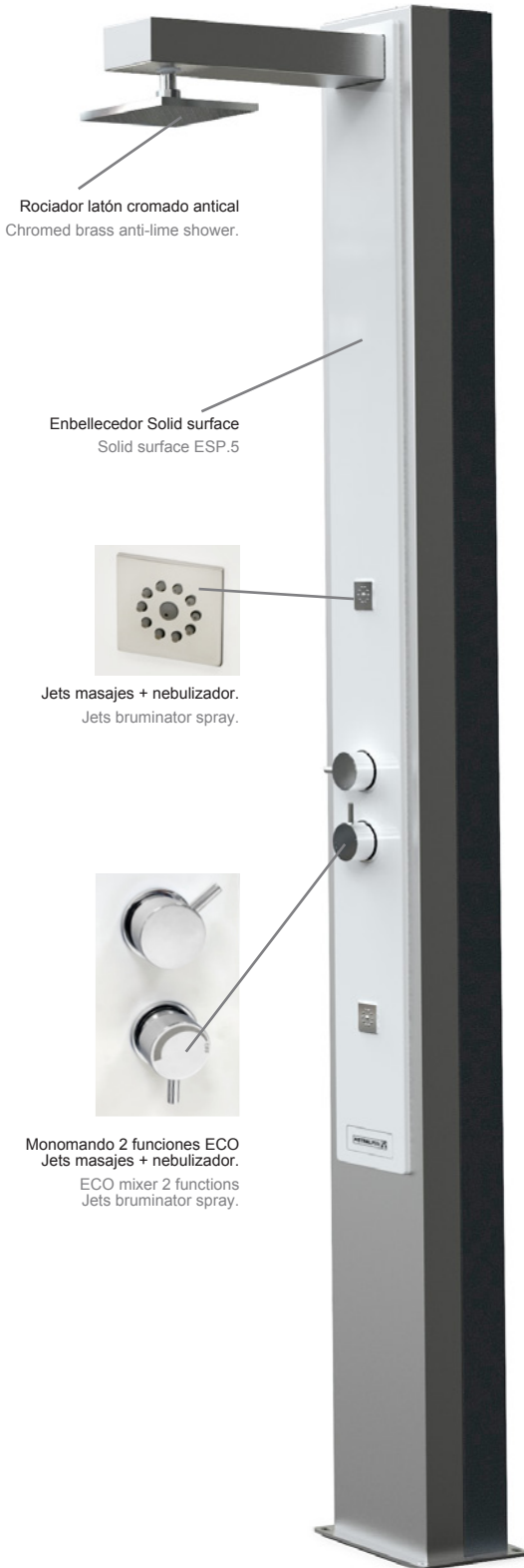
Rociador latón cromado antical Chromed brass anti-lime shower.